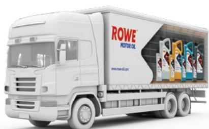
LKW-Transport / Truck Shipments

*2-lagig stapelbar./Stackable in 2 layers.