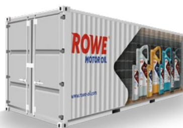
Container-Verschiffung / Container Shipments